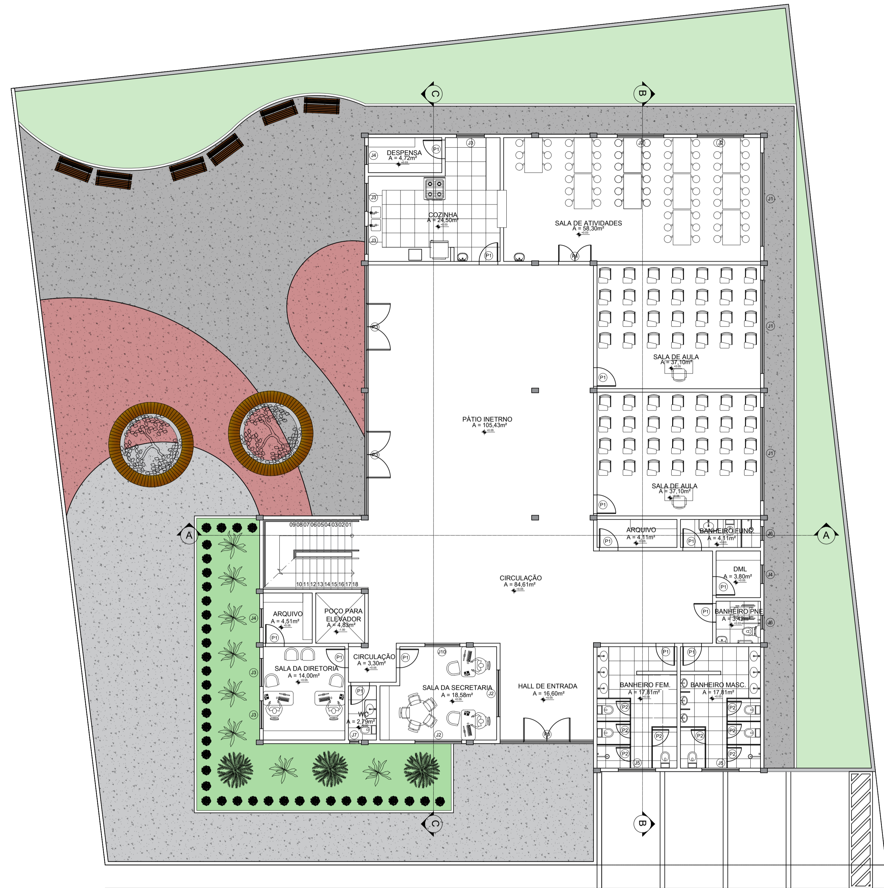
PLANTA DE LAYOUT - PAVIMENTO TÉRREO ESCALA: 1/100